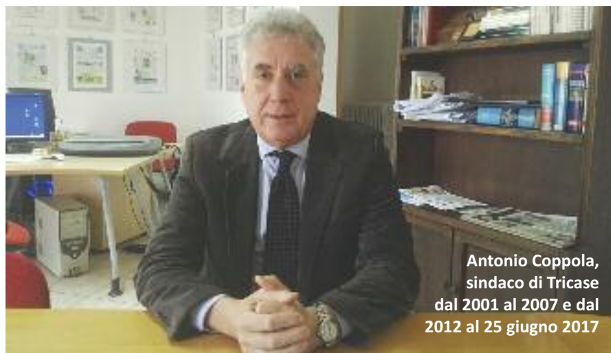
Antonio Coppola, sindaco di Tricase dal 2001 al 2007 e dal 2012 al 25 giugno 2017

Comune condannato. Riconosciuta «la insussistenza di ipotesi di incompatibilità con l'esercizio dell'attività libero-professionale». L'ente comunale dovrà provvedere al pagamento di 9mila euro