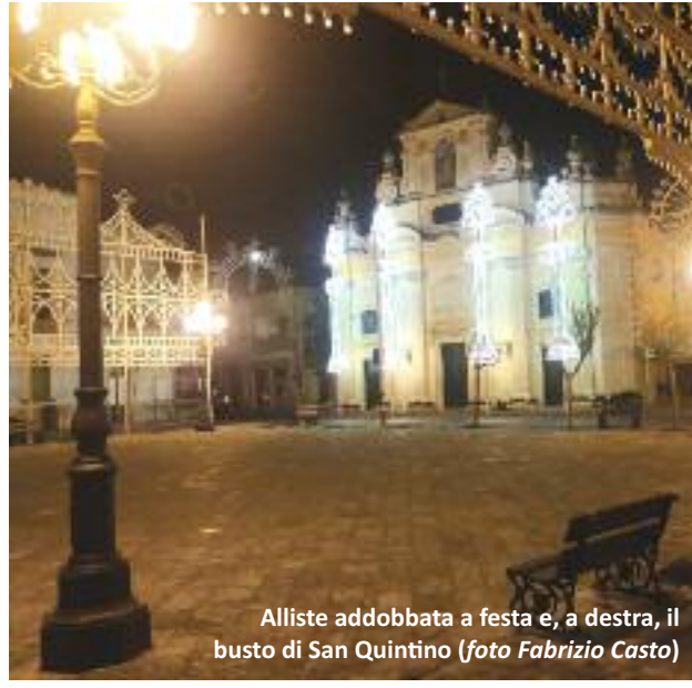
Alliste addobbata a festa e, a destra, il busto di San Quintino

Alliste. I devoti chiedono l'intercessione per gravi malattie, in particolare quelle del naso