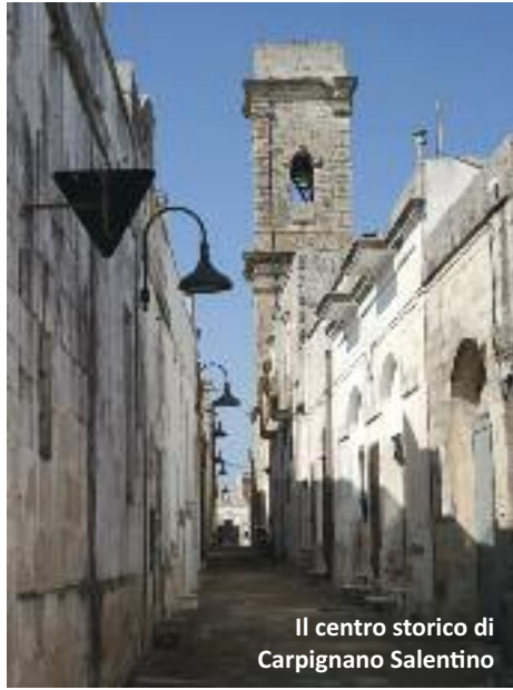
Il centro storico di Carpignano Salentino

➤ Torna a Carpignano Salentino una delle fiere più antiche ed importanti del Salento. Risalente all'incirca all'anno mille, originariamente era denominata Fiera di San Cosimo e legata al culto dei Santi Medici, quando si svolgeva fuori dal paese, in località San Cosimo, dove vi era un'antica Chiesa di cui oggi esistono pochi ruderi. La fiera di Ognissanti a Carpignano era essenzialmente agricola e dato l'approssimarsi dell'inverno, dava la possibilità di scambiare beni e strumenti necessari per la fredda stagione. Poi da San Cosimo la fiera venne trasferita in paese e, negli anni, è diventata sempre più grande ed importante, a tal punto che oggi occupa gran parte dell'abitato carpignanese e, pur conservando l'antica natura di fiera legata al mondo rurale, accanto al commercio ed all'esposizione di prodotti agricoli (soprattutto macchine agricole), si possono trovare prodotti di ogni tipo. La Pro Loco negli ultimi anni ha organizzata all'interno della fiera l'esposizione "Salento Produce", ossia prodotti realizzati dall'industria e dall'artigianato salentini. Rinomata è poi la fiera degli animali, che si svolge nei pressi del campo sportivo, dove è ancora possibile assistere alla pantomima dei sensali, impegnati nella mediazione del bestiame. Da circa una quarantina d'anni, inoltre, è stata ripresa la tradizione del macello e della vendita del maiale paesano, così ha luogo un'importante sagra con degustazione di carni suine preparate secondo le tradizionali ricette locali.