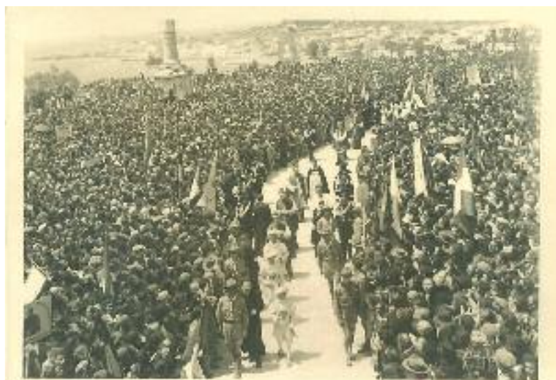
S. Maria di Leuca, piazza del santuario, maggio 1949. Una imponente manifestazione religiosa durante il Congresso mariano salentino. Sullo sfondo la base della colonna votiva e la croce petrina.

La richiesta, partita da Ugento il 16 luglio 1959, si fondava sul fatto che la diocesi ugentina fosse una "diocesi mariana" e mons. Ruotolo lo aveva bene argomentato nella lettera pastorale per la quaresima 1959, dal titolo Madonna di Leuca nostra speranza . Tuttavia non dovette essere estranea, all'iniziativa del vescovo Ruotolo, l'imminenza del concilio ecumenico che s. Giovanni XXIII aveva convocato il 25 gennaio 1959: la nuova denominazione della diocesi avrebbe consentito ai padri conciliari di localizzarne più facilmente la posizione geografica. Il decreto, in sintesi, riportava tutte le motivazioni sulle quali poggiava la richiesta riconoscendone pienamente la validità e dunque meritevole di accoglimento. Lo storico documento si apre sottolineando l'importanza storico-religiosa del santuario mariano e della città di Leuca, la cui sede episcopale, a causa delle incursioni nemiche, dal papa avignonese Giovanni XXII, nel 1333, era stata trasferita ad Alessano, diocesi a sua volta soppressa nel 1818 e confluita in quella di Ugento. Il decreto riconosce poi i motivi di carattere pastorale addotti dal vescovo Ruotolo: confermare nei fedeli di