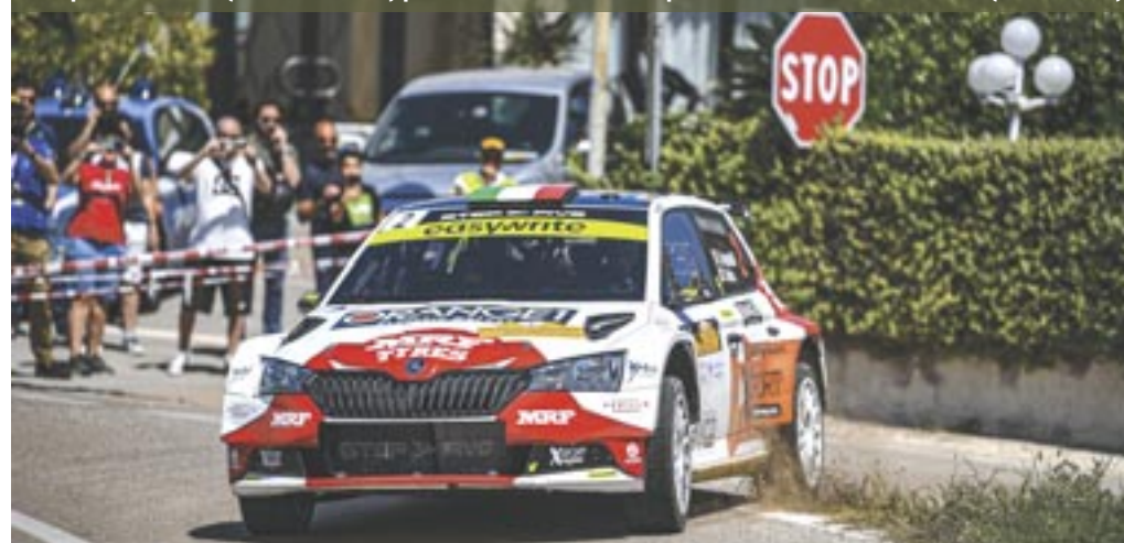
Campebelli-Canton (Skoda Fabia R5) primi al Salento '23 a campioni in carica nel C.I.R. Asfalto

gramma: "Torre Paduli" , di 11,30 Km, alle 11:20 e 15:27 , "Ciolo" , di 11,75 Km, alle 12:05 e 16:12 , e "Specchia" , di 13,06 Km (la più lunga del rally), alle 12:49 e 16:56 .